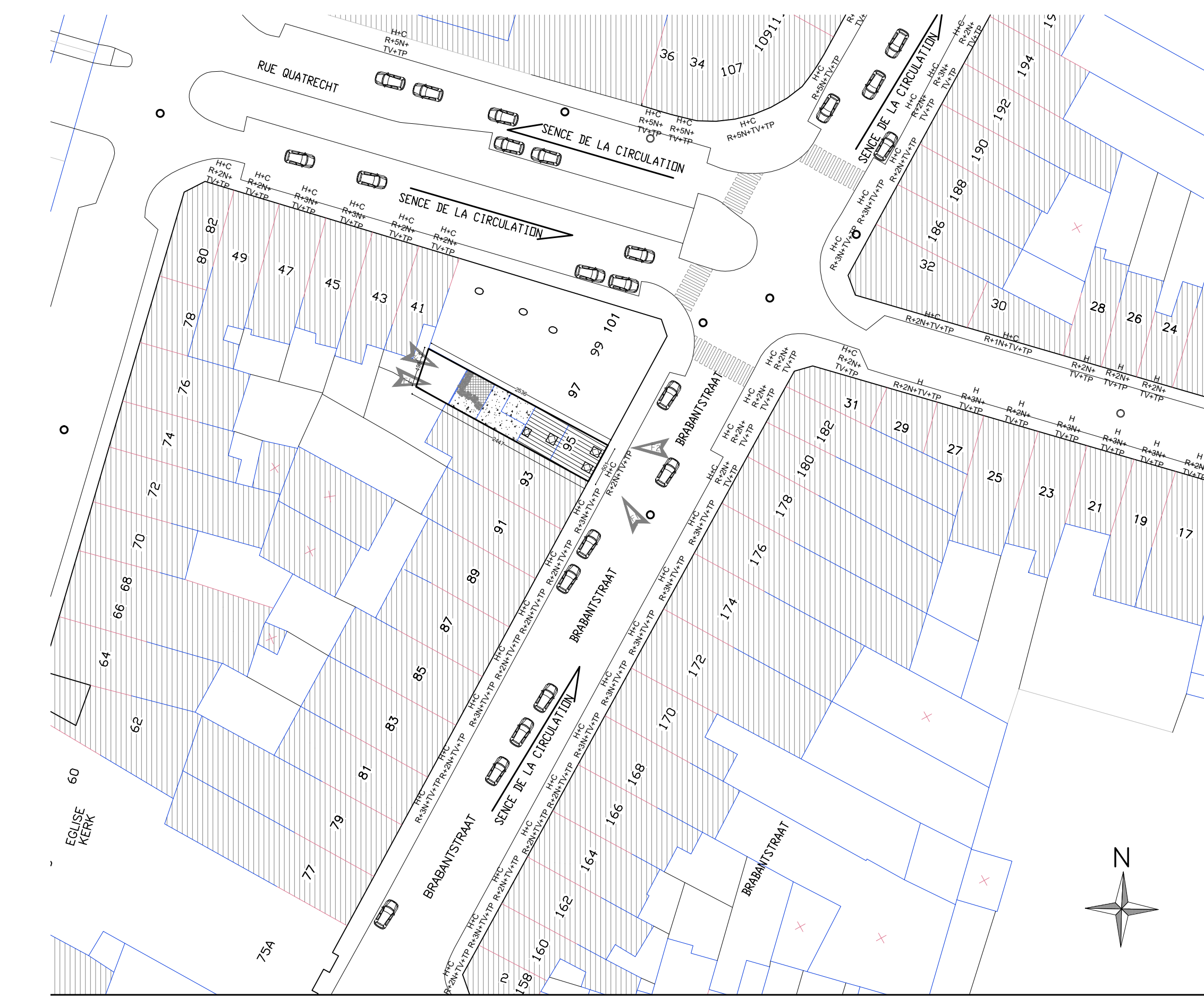
IMPLANTATION ECH: 1/500